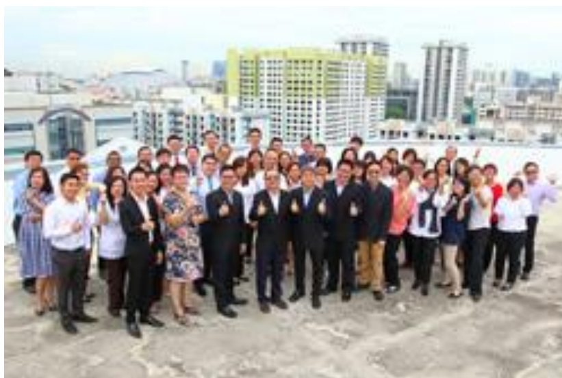
ACTS 学院 2015-至今